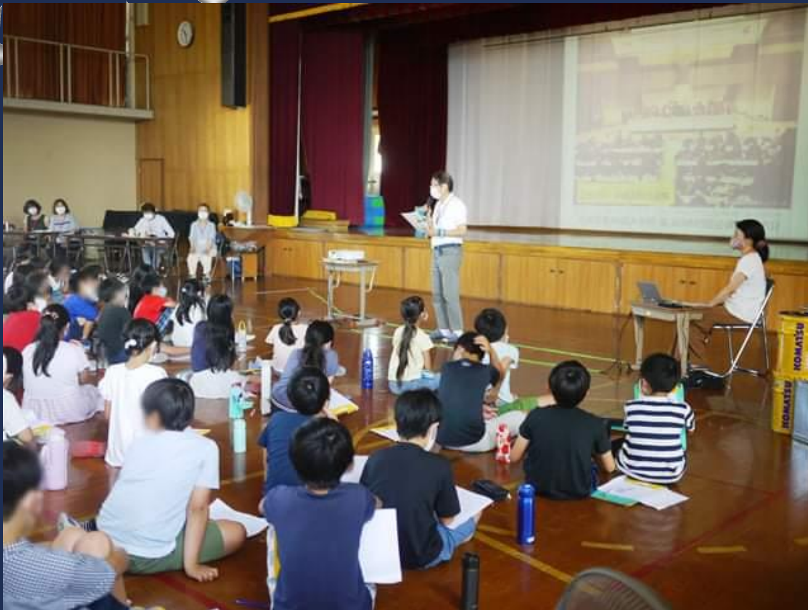
▲ 2021/7/19 桃山小学校5年生 環境出前授業（参加生徒80名）