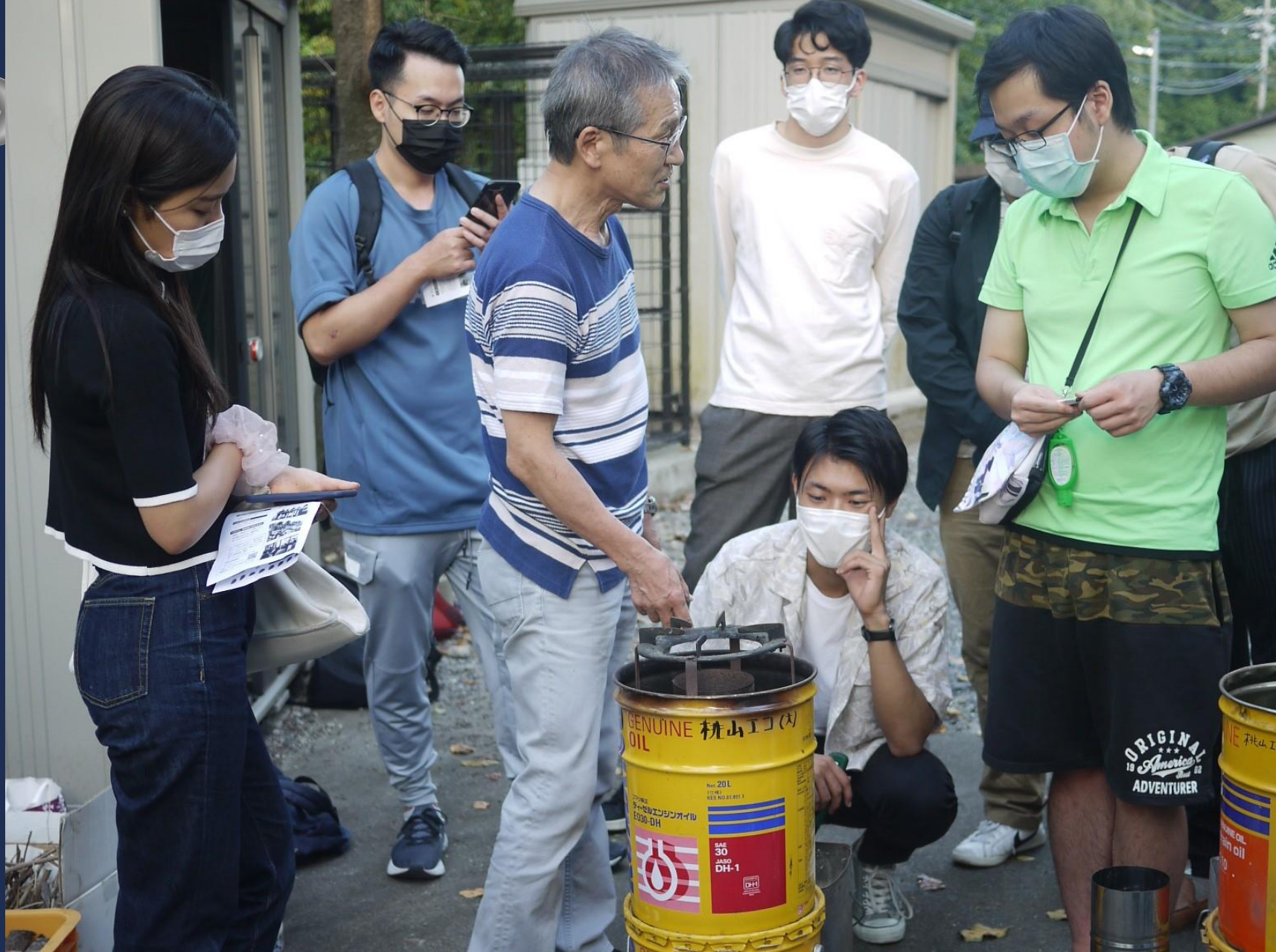
▲2021/10/9 ロケットストーブの燃焼実演 京外大学生・教職員の視察見学@桃山小学校