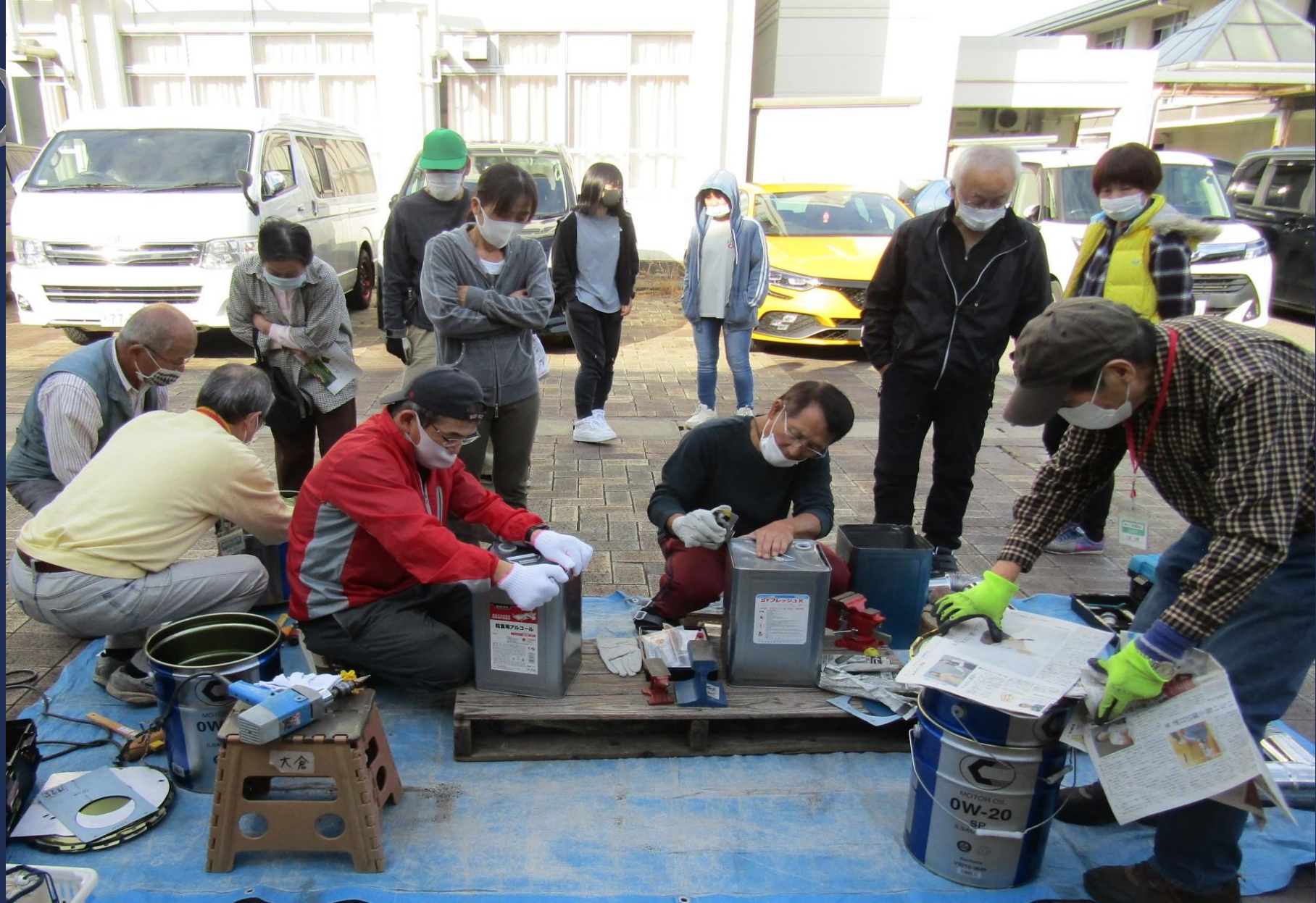
▲2021/10/30 ロケットストーブ手作りワークショップ @久我の杜小学校