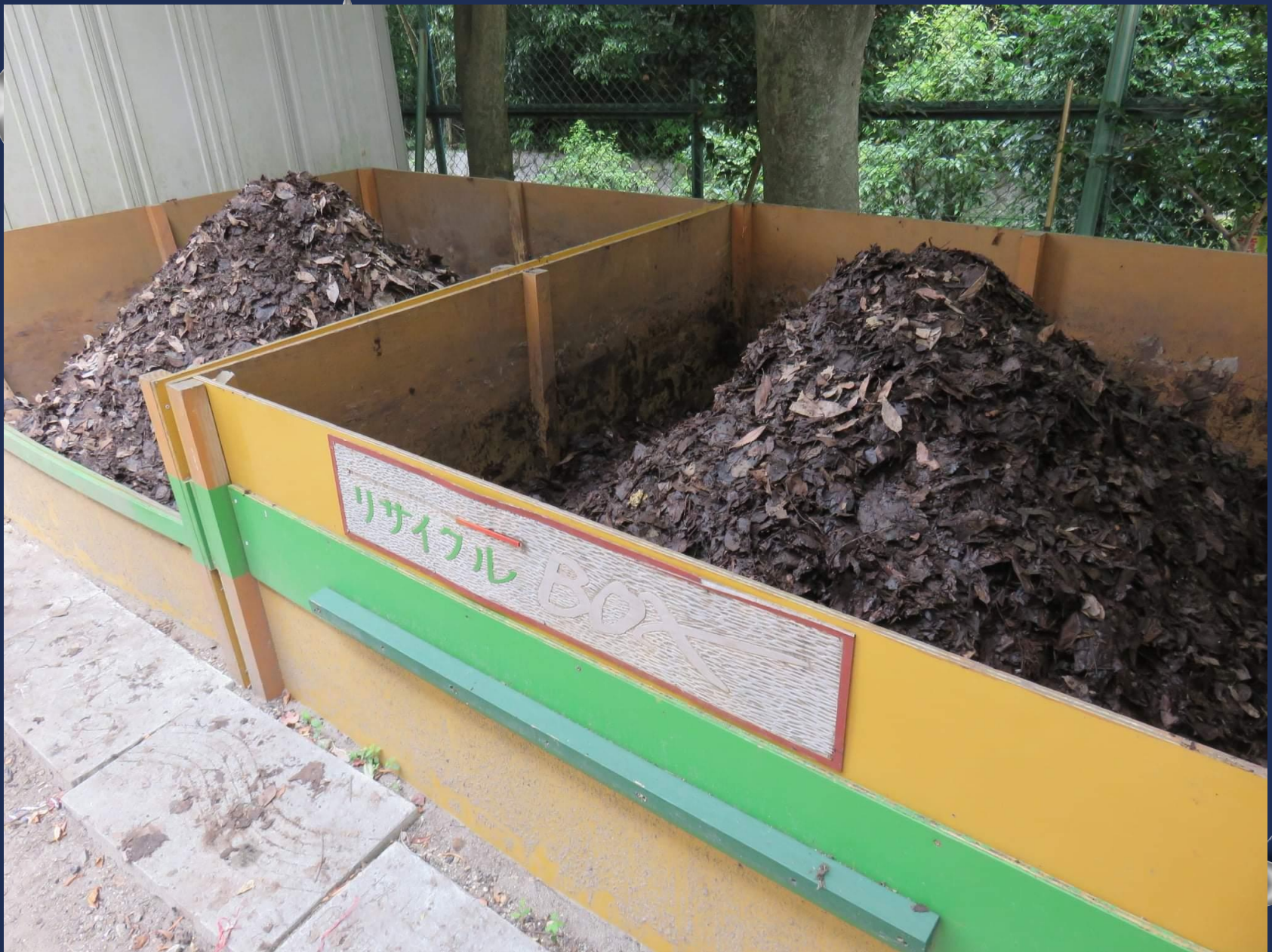
▲ 2021/7/26 落ち葉の切り返し作業