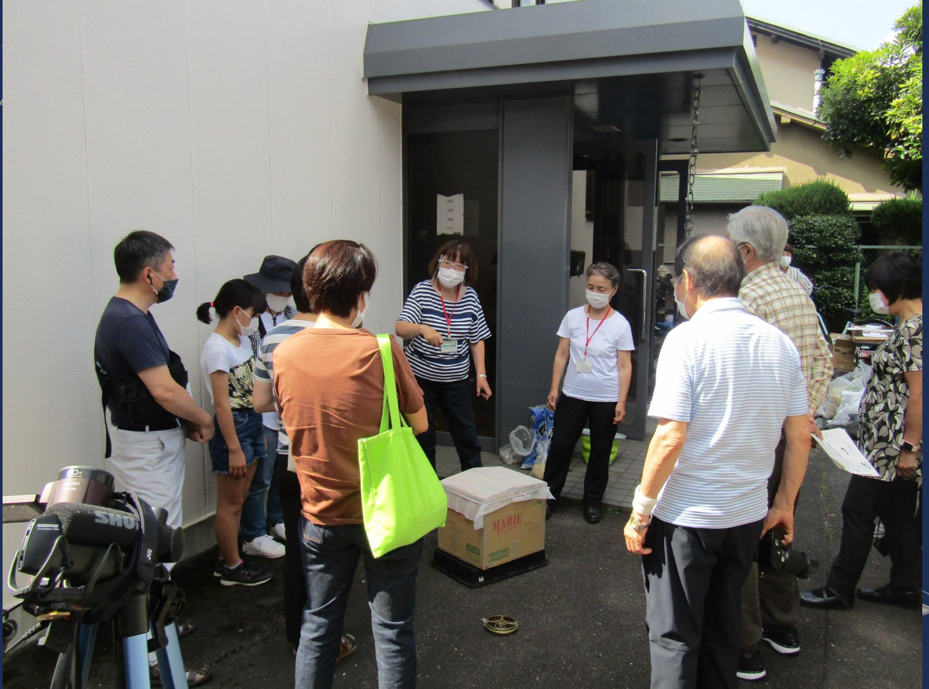
▲2021/9/25 生ごみ堆肥講習会（参加者19名）