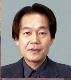
井上 章一（いのうえ しょういち）

1886年6月竣工。プロテスタントのレンガ造チャペルとしては日本に現存する最古の建物（D.C.グリーンによる設計）。正面中央に円形のバラ窓、左右にアーチ窓を設け、その前に屋根と尖りアーチの入口を持っており、ゴシック建築の特徴が出ています。1963年7月、重要文化財に指定されています。