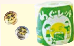
※プレゼントの写真はイメージです